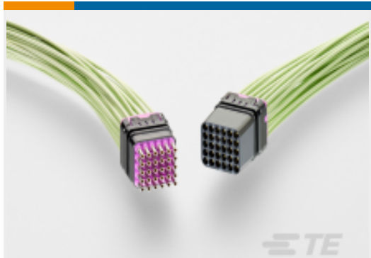
TE 产品编号ZPF000000000203398 DMC-MR 30-23 PC