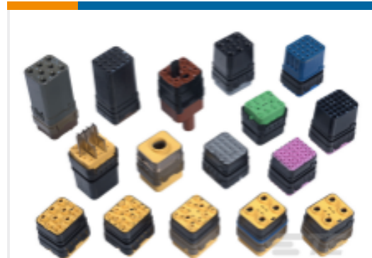
TE 产品编号ZPF000000000203708 DMC-M 99-10 PC