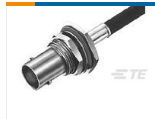
TE 产品编号225398-6 CONNECTOR, BNC DUAL CRIMP JACK