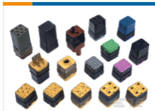
TE 产品编号ZPF000000000203708 DMC-M 99-10 PC