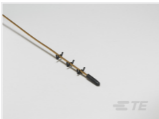
TE 产品编号CAT-TRA0001 Piezoelectric Traffic Sensor