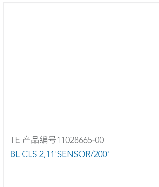
TE 产品编号11028665-00 BL CLS 2,11'SENSOR/200'