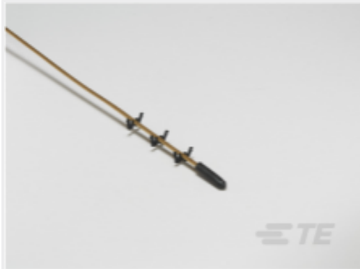
TE 产品编号 11032408-00 BL CLS 1, 11'SENSOR/300' CABLE