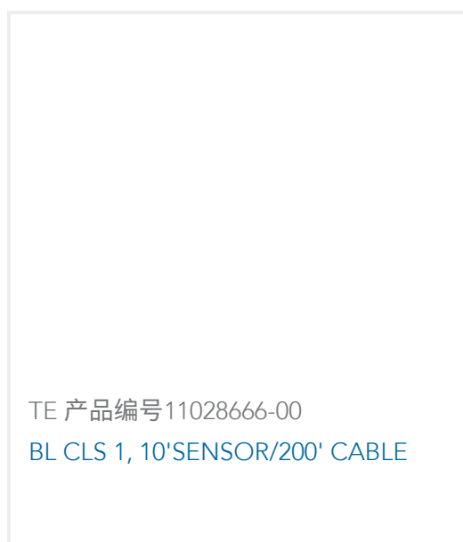
TE 产品编号11028666-00 BL CLS 1, 10'SENSOR/200' CABLE