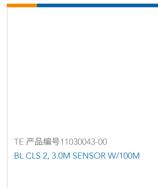
TE 产品编号11030043-00 BL CLS 2, 3.0M SENSOR W/100M