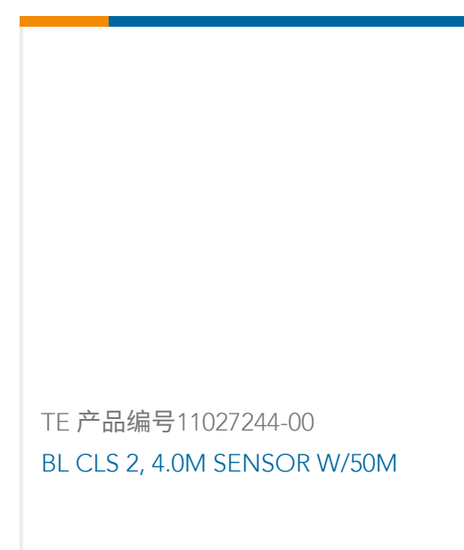
TE 产品编号11027244-00 BL CLS 2, 4.0M SENSOR W/50M