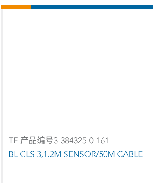
TE 产品编号3-384325-0-161 BL CLS 3, 1.2M SENSOR/50M CABLE