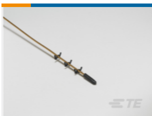
TE 产品编号11026278-00 Piezoelectric Traffic Sensor