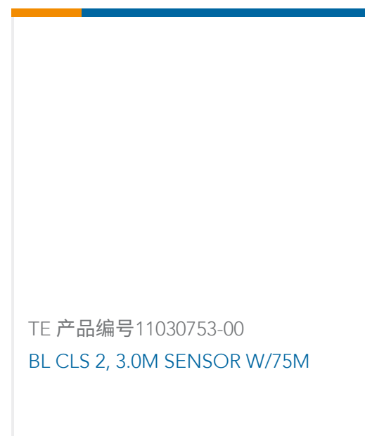
TE 产品编号11030753-00 BL CLS 2, 3.0M SENSOR W/75M