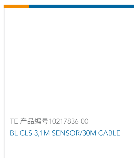
TE 产品编号10217836-00 BL CLS 3, 1M SENSOR/30M CABLE