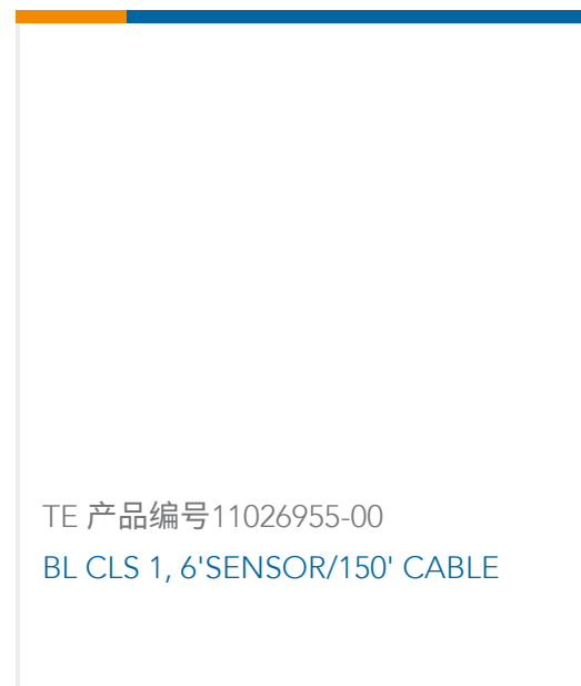
TE 产品编号11026955-00 BL CLS 1, 6'SENSOR/150' CABLE