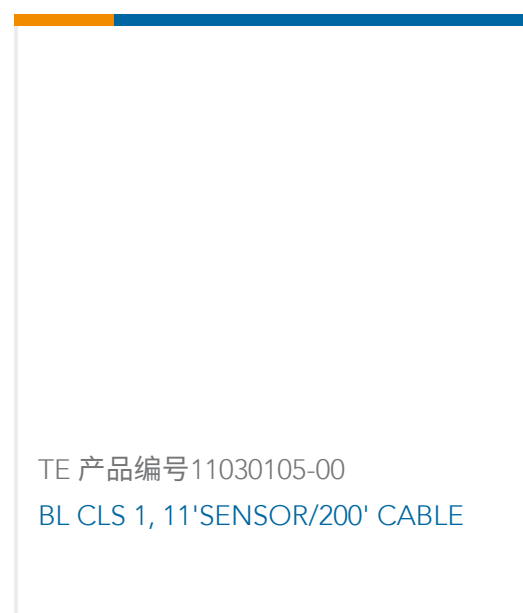
TE 产品编号11030105-00 BL CLS 1, 11'SENSOR/200' CABLE