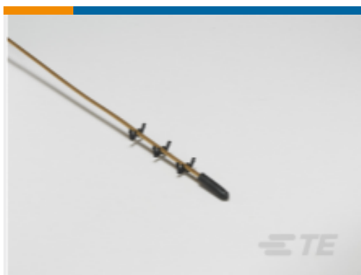
TE 产品编号11029062-00 Piezoelectric Traffic Sensor