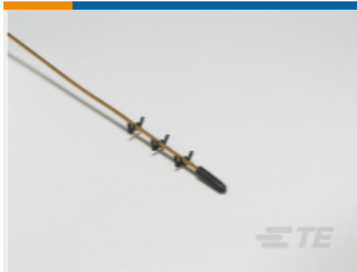
TE 产品编号 11031492-00 BL CLS 1, 3.5MSENSOR W/50M