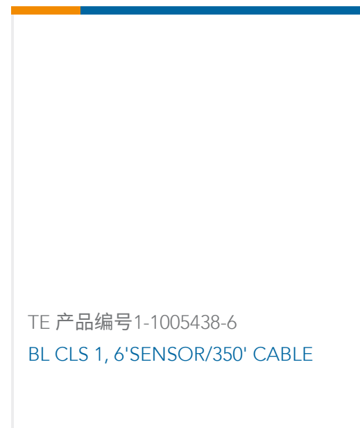
TE 产品编号1-1005438-6 BL CLS 1, 6'SENSOR/350' CABLE