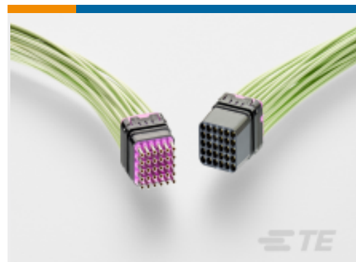
TE 产品编号ZPF00000000203398 DMC-MR 30-23 PC