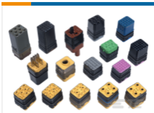
TE 产品编号ZPF00000000203708 DMC-M 99-10 PC