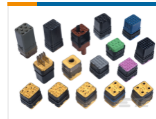
TE 产品编号ZPF000000000202094 DMC-M 0402 AW 01