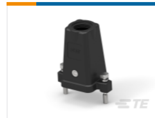
TE 产品编号T1926030116-009 H3APR-TGC-M16-EMC-C