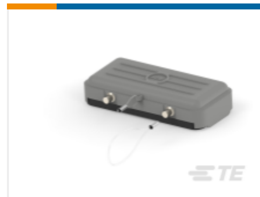
TE 产品编号T1010161600-000 H16B-KDTP-BO