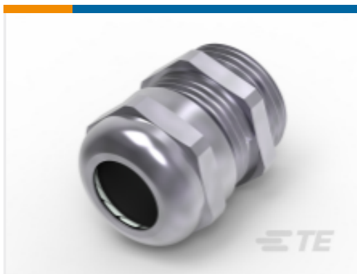
TE 产品编号T3609200102-000 DLX-20-M