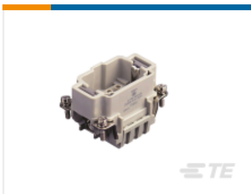
TE 产品编号T2040064101-000 HE-006-MC