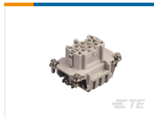
TE 产品编号T2040064201-000 HE-006-FC