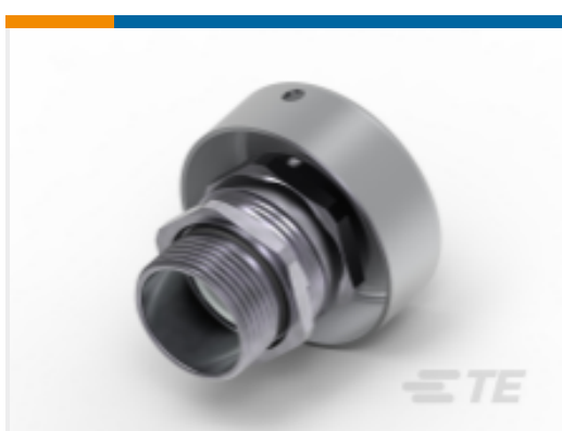
TE 产品编号T3900250250-000 M25X1.5 VA-25-LM