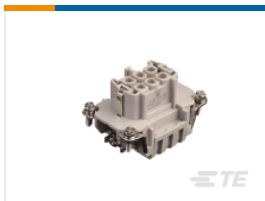
TE 产品编号T2040064201-000 HE-006-FC