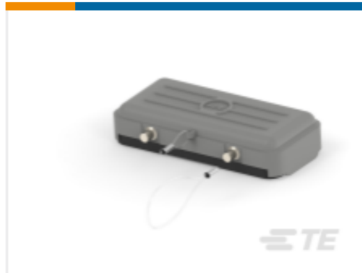
TE 产品编号T1010161600-000 H16B-KDTP-BO