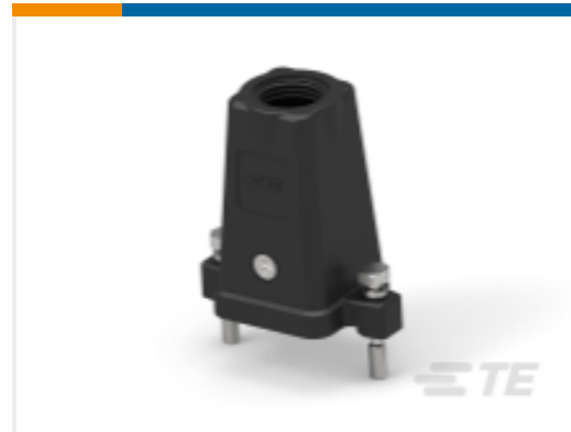
TE 产品编号T1926030116-009 H3APR-TGC-M16-EMC-C