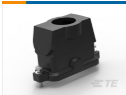
TE 产品编号T1922160140-000 H16BPR-TGHC-M40