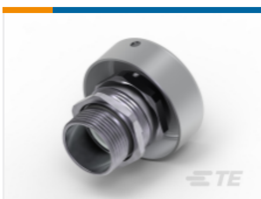
TE 产品编号T3900250250-000 M25X1.5 VA-25-LM