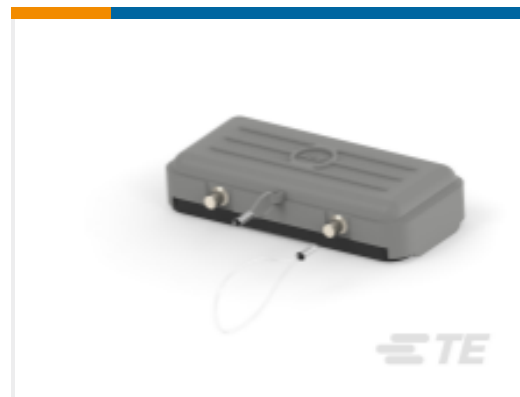
TE 产品编号T1010161600-000 H16B-KDTP-BO