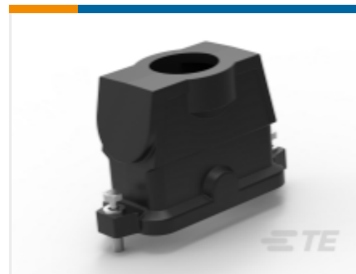
TE 产品编号T1922160140-000 H16BPR-TGHC-M40