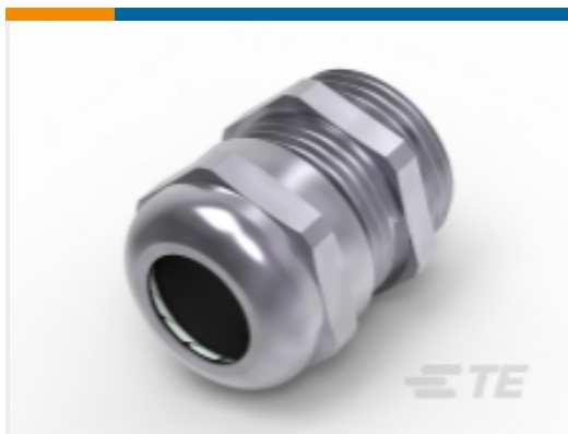
TE 产品编号T3609200102-000 DLX-20-M