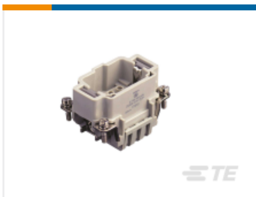
TE 产品编号T2040064101-000 HE-006-MC