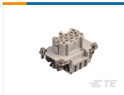
TE 产品编号T2040064201-000 HE-006-FC