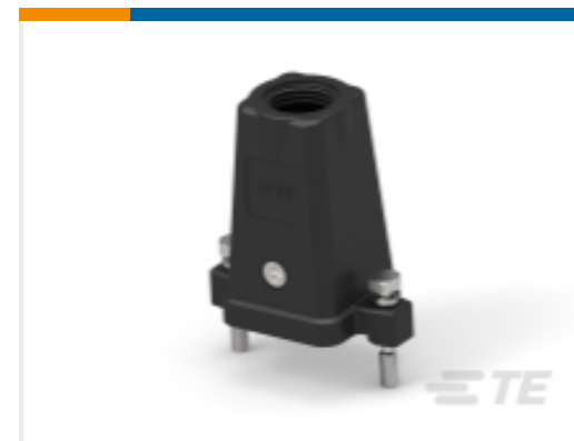
TE 产品编号T1926030116-009 H3APR-TGC-M16-EMC-C