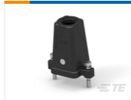
TE 产品编号T1926030116-009 H3APR-TGC-M16-EMC-C