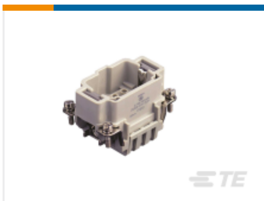
TE 产品编号T2040064101-000 HE-006-MC