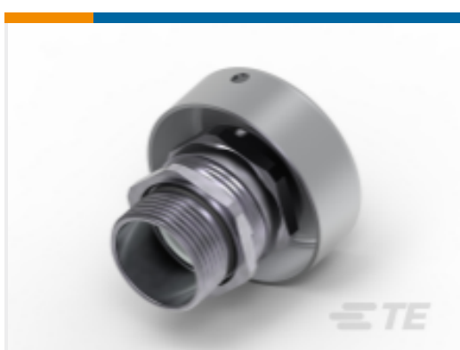
TE 产品编号T3900250250-000 M25X1.5 VA-25-LM