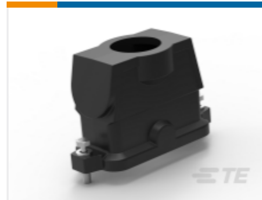
TE 产品编号T1922160140-000 H16BPR-TGHC-M40