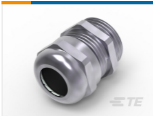
TE 产品编号T3609200102-000 DLX-20-M