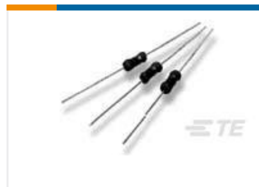
TE 产品编号1-1625893-4 5W SM M/OX 2% 27R