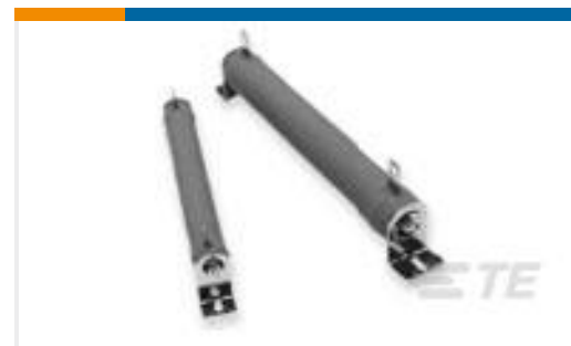
TE 产品编号1-1879447-8 TE 200W 27R 5% Bracket