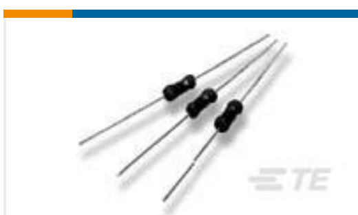
TE 产品编号4-1879355-9 RR03 5% 430K AMMO