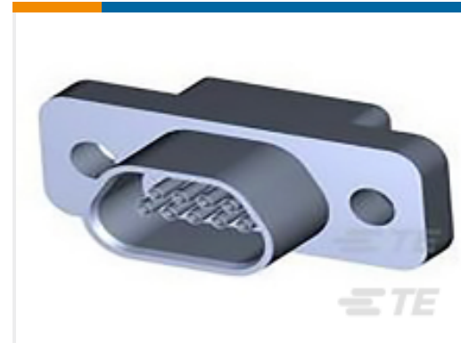
TE 产品编号1532206-2 M83513/02-FC, MCKS-C2-B-37SS