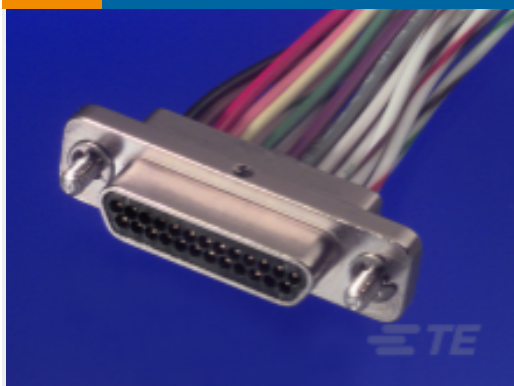
TE 产品编号1532179-7 M83513/03-A11N, MCKS-N1-B-9P6Q9- 18.0