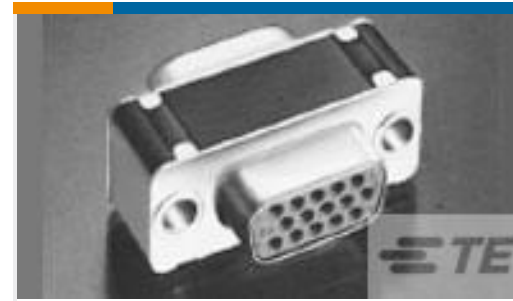
TE 产品编号211012-4 AMPLIMITE CONN SVR,44 POS,TRW