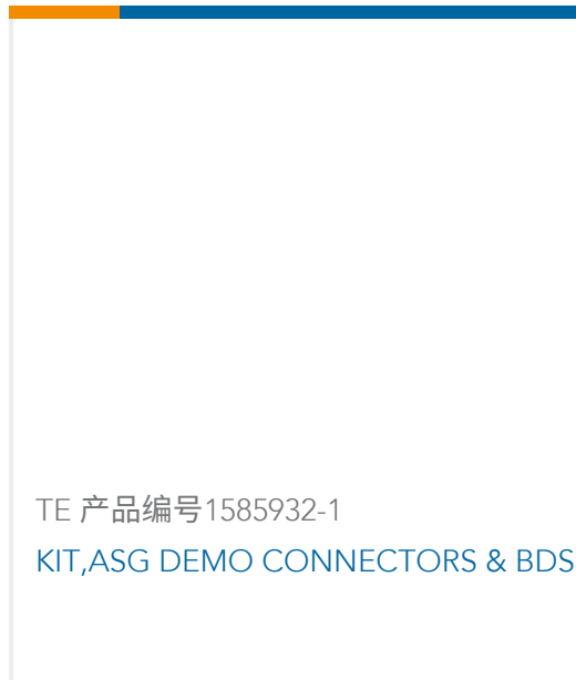
TE 产品编号1585932-1 KIT,ASG DEMO CONNECTORS & BDS