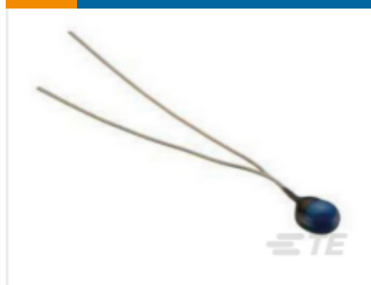
TE 产品编号SP44907X-22 44907X GSFC 311P18-07S101