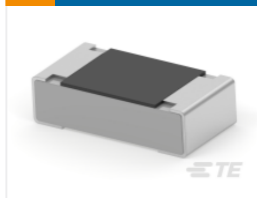
TE 产品编号2176340-1 CRGCQ 0603 1R0 5%