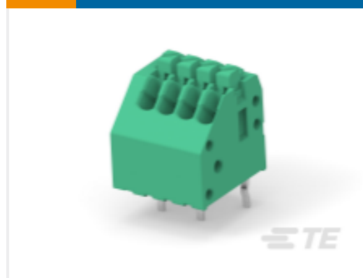
TE 产品编号1-2834021-4 4POS 2.5MM TES CONN.