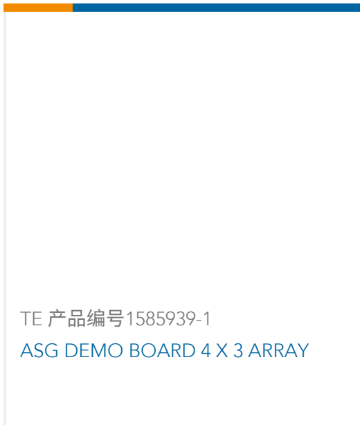
TE 产品编号1585939-1 ASG DEMO BOARD 4 X 3 ARRAY