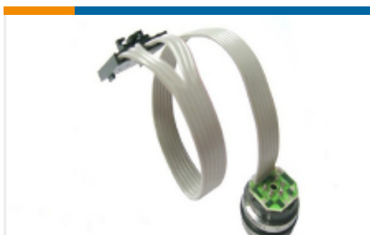
TE 产品编号86-100G-R 100 PSIG RIBBON CABLE MV PRESSURE SENSOR