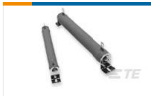
TE 产品编号1-1879447-8 TE 200W 27R 5% Bracket