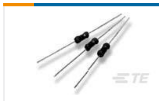
TE 产品编号7-1879350-5 RR01 5% 270R AMMO