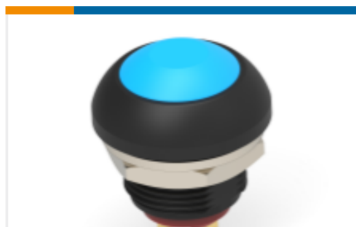
TE 产品编号2-2329383-5 PB ON/OFF FC BLU M1 TERM IP68