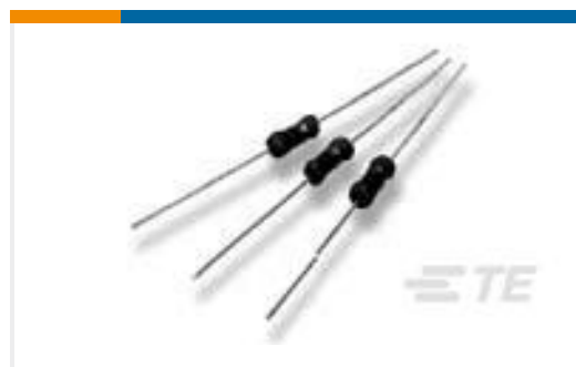
TE 产品编号1-1625893-4 5W SM M/OX 2% 27R