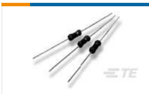
TE 产品编号4-1879355-9 RR03 5% 430K AMMO