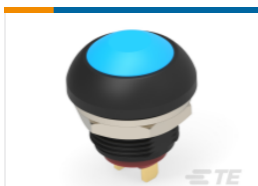
TE 产品编号2-2329383-5 PB ON/OFF FC BLU M1 TERM IP68