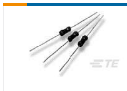
TE 产品编号7-1879350-5 RR01 5% 270R AMMO