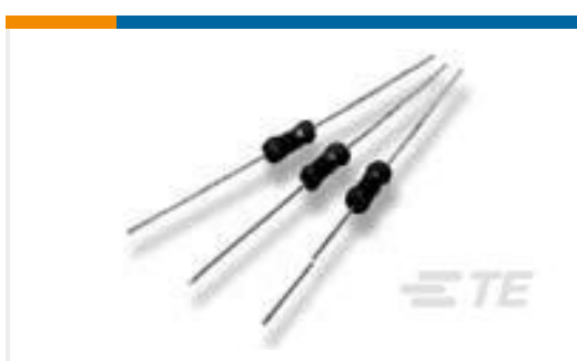
TE 产品编号4-1879355-9 RR03 5% 430K AMMO