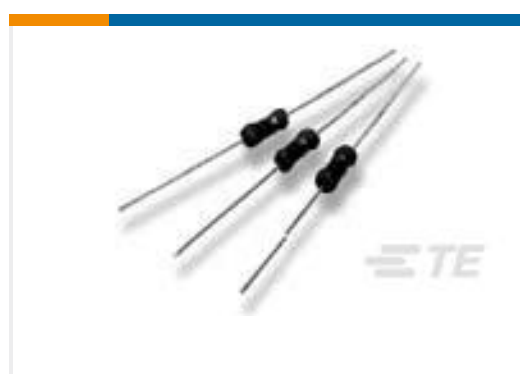
TE 产品编号1-1625893-4 5W SM M/OX 2% 27R