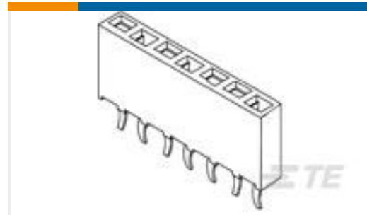
TE 产品编号215297-4 4P HV100 REC CON. TE, 7.0MM