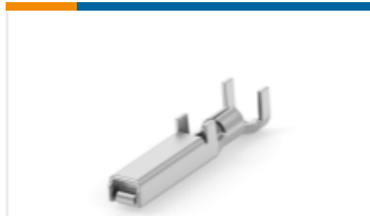
TE 产品编号1-175217-2 Contact: Component To Wire; 15A, 28-14 wire size