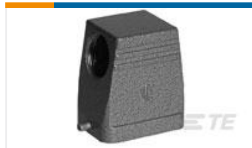
TE 产品编号2-1106452-4 HD.40.STO-GR.1.M32G