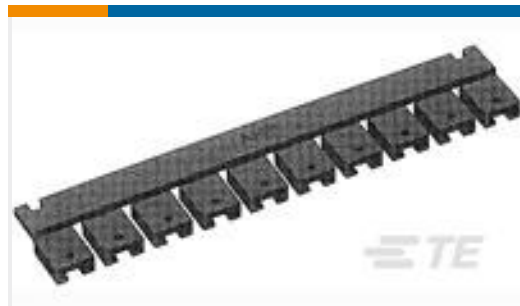
TE 产品编号531230-4 SHUNT, 200 C/L, 2 POS, SN