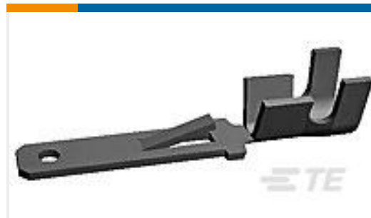
TE 产品编号170014-5 FF 110 TAB 20-16AWG BR