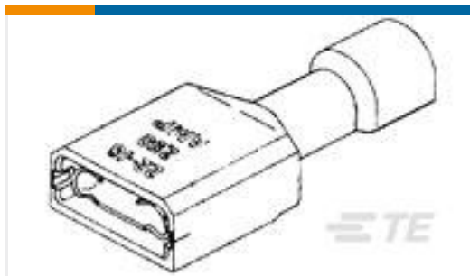
TE 产品编号3-520370-2 ULTRA-FAST 110/125 ASY REC 16-14AWG TPBR