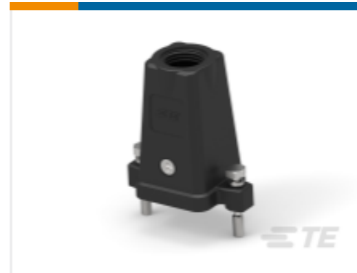
TE 产品编号T1926030116-009 H3APR-TGC-M16-EMC-C