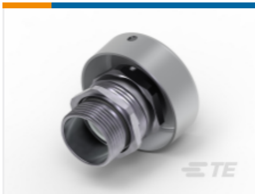
TE 产品编号T3900250250-000 M25X1.5 VA-25-LM