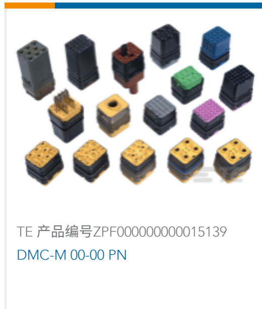
TE 产品编号ZPF000000000015139 DMC-M 00-00 PN