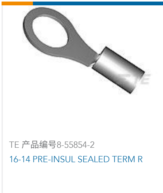
TE 产品编号8-55854-2 16-14 PRE-INSUL SEALED TERM R