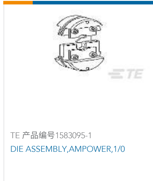
TE 产品编号1583095-1 DIE ASSEMBLY,AMPOWER,1/0