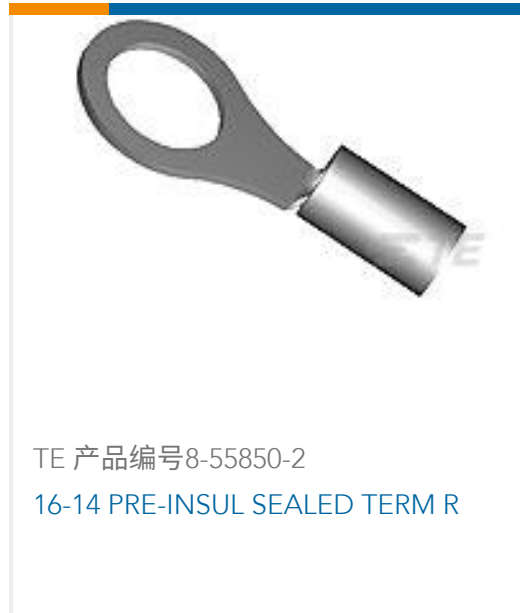
TE 产品编号8-55850-2 16-14 PRE-INSUL SEALED TERM R