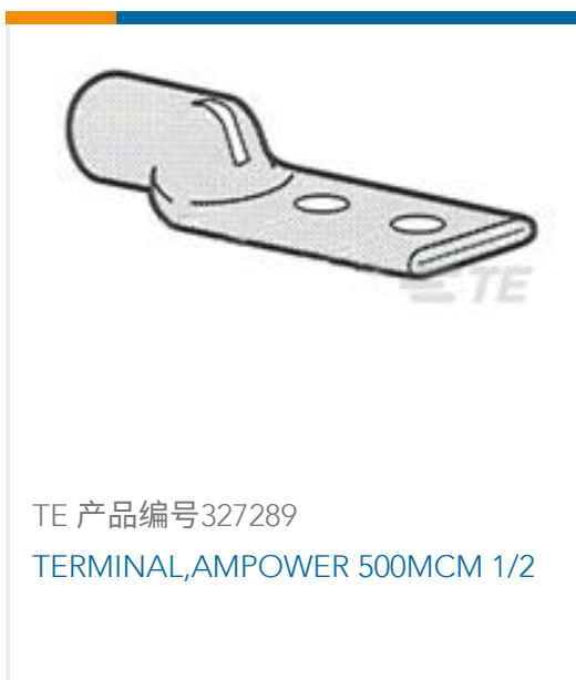
TE 产品编号327289 TERMINAL,AMPOWER 500MCM 1/2