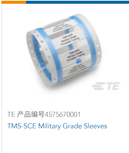
TE 产品编号4575670001 TMS-SCE Military Grade Sleeves