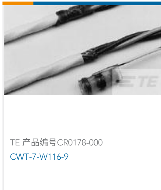
TE 产品编号CR0178-000 CWT-7-W116-9