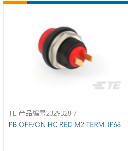
TE 产品编号2329328-7 PB OFF/ON HC RED M2 TERM. IP68