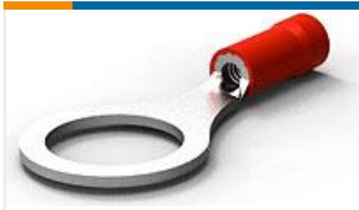
TE 产品编号34152 PG R 22-16 COMM 22-18 MIL 3/8