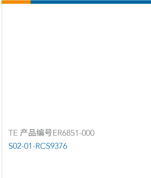
TE 产品编号ER6851-000 S02-01-RCS9376