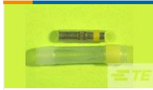
TE 产品编号650110-000 D-436-0128