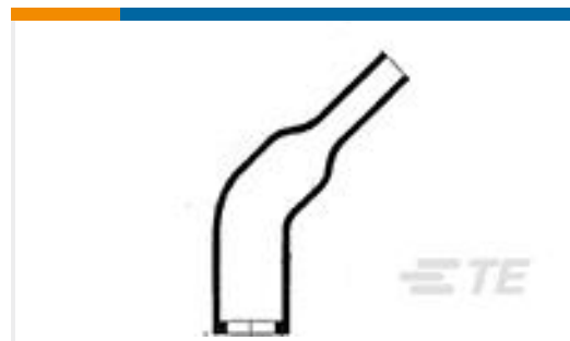
TE 产品编号980286-000 242W042-25-0