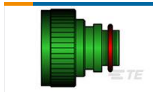
TE 产品编号293973-000 TXR40AB00-1612AI