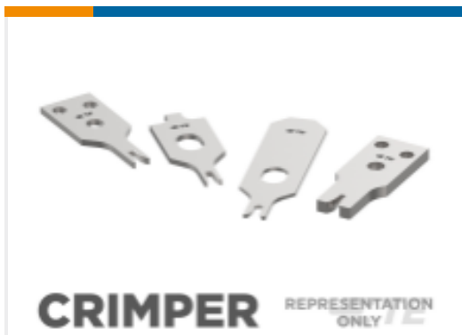
CRIMPER REPRESENTATION ONLY