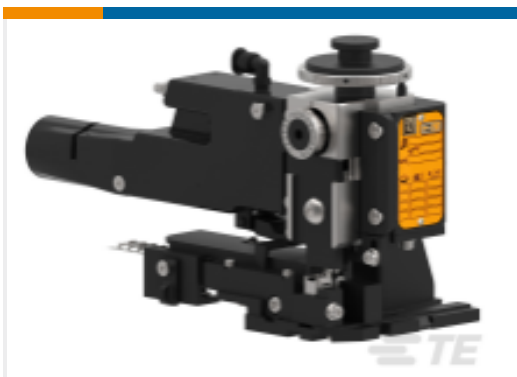
TE 产品编号2836127-2 OCEAN-2.0-APPLICATOR-S-117F197O-RSA