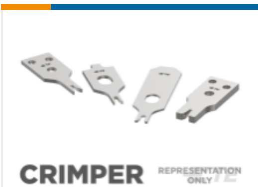
CRIMPER REPRESENTATION ONLY