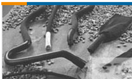
TE 产品编号CH22266001 HFT5000-30/15-0-615MM