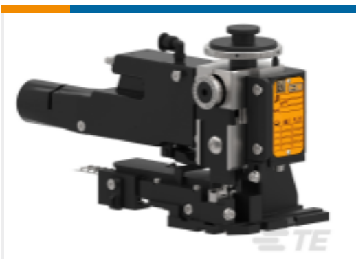
TE 产品编号2266260-2 OCEAN_2.0_APPLICATOR-S-062F134O-RSA