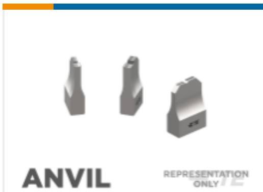
ANVIL REPRESENTATION ONLY