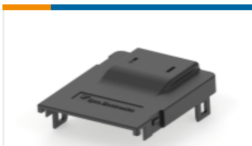
TE 产品编号1986186-1 Strain Relief,20 Posn,D3000 Dynamic, 2