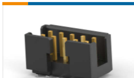
TE 产品编号1-2373376-0 10P,2MM,SHRD HDR,DRVVT,SMD,0.1 AU,TB