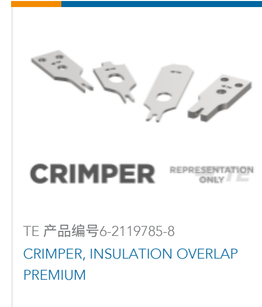
CRIMPER REPRESENTATION ONLY TE 产品编号6-2119785-8 CRIMPER, INSULATION OVERLAP PREMIUM