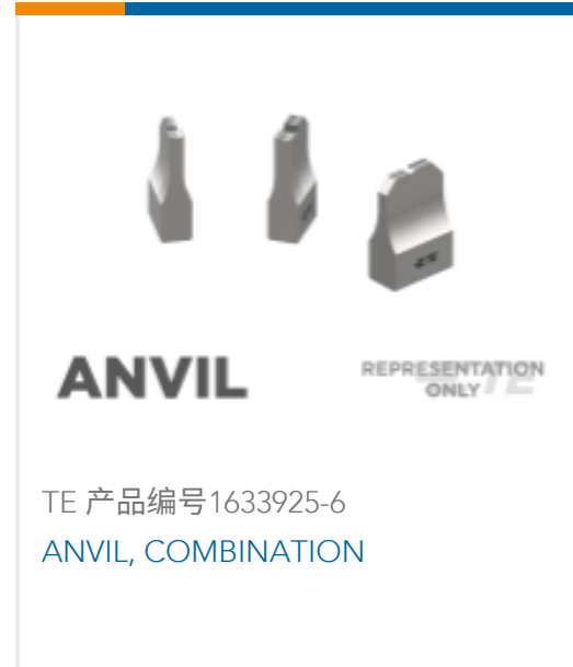
ANVIL REPRESENTATION ONLY TE 产品编号1633925-6 ANVIL, COMBINATION