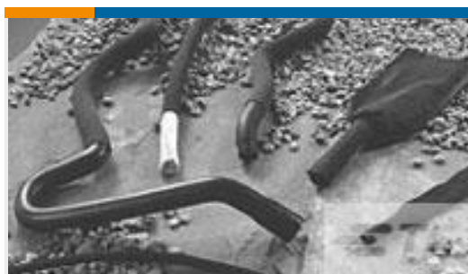
TE 产品编号CH20776001 HFT5000-30/15-0-410MM