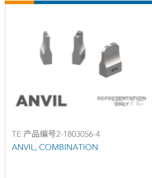
ANVIL REPRESENTATION ONLY TE 产品编号2-1803056-4 ANVIL, COMBINATION