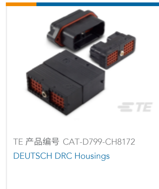
TE 产品编号 CAT-D799-CH8172 DEUTSCH DRC Housings