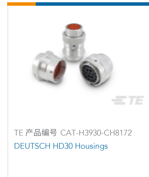
TE 产品编号 CAT-H3930-CH8172 DEUTSCH HD30 Housings