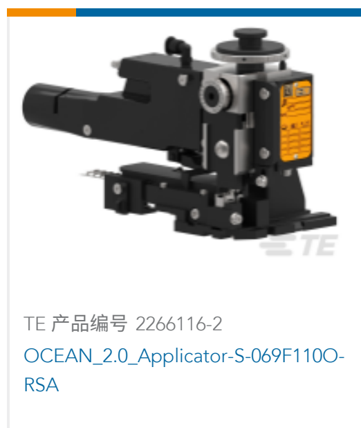
TE 产品编号 2266116-2 OCEAN_2.0_Applicator-S-069F1100-RSA