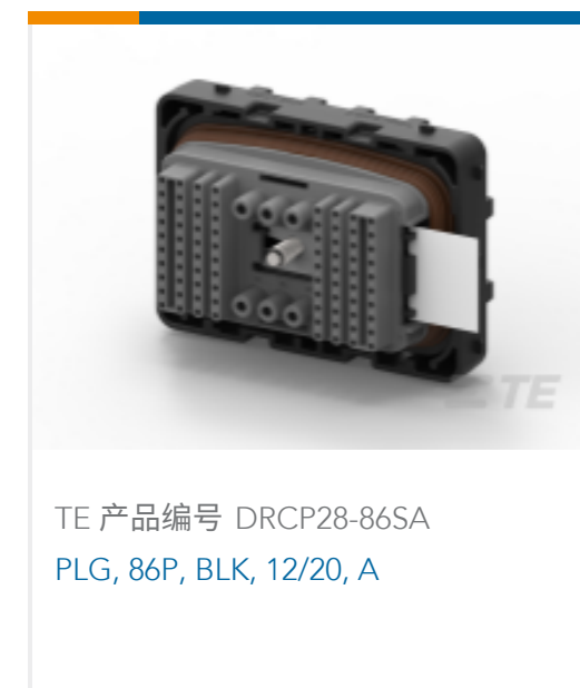
TE 产品编号 DRCP28-86SA PLG, 86P, BLK, 12/20, A