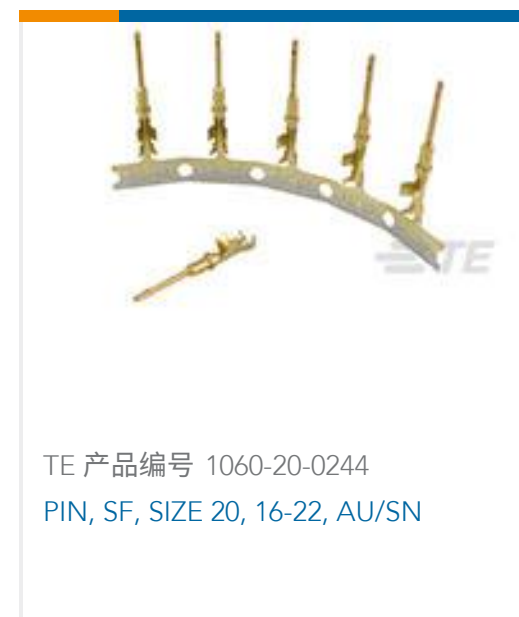
TE 产品编号 1060-20-0244 PIN, SF, SIZE 20, 16-22, AU/SN