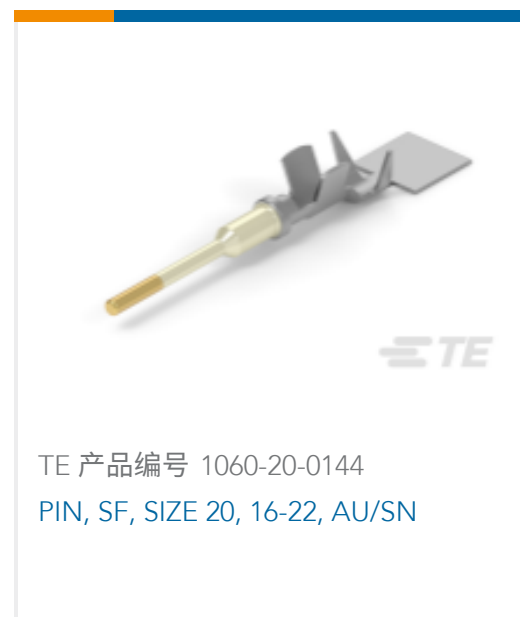
TE 产品编号 1060-20-0144 PIN, SF, SIZE 20, 16-22, AU/SN