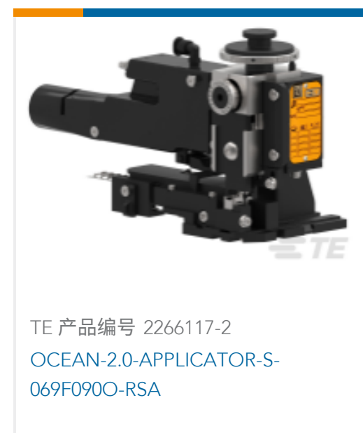
TE 产品编号 2266117-2 OCEAN-2.0-APPLICATOR-S-069F0900-RSA