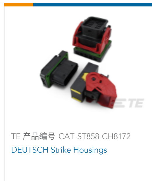
TE 产品编号 CAT-ST858-CH8172 DEUTSCH Strike Housings