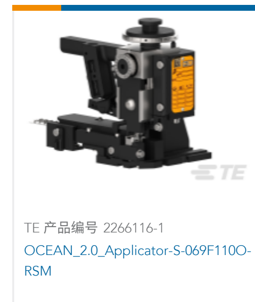
TE 产品编号 2266116-1 OCEAN_2.0_Applicator-S-069F1100-RSM