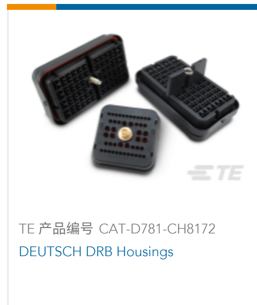
TE 产品编号 CAT-D781-CH8172 DEUTSCH DRB Housings