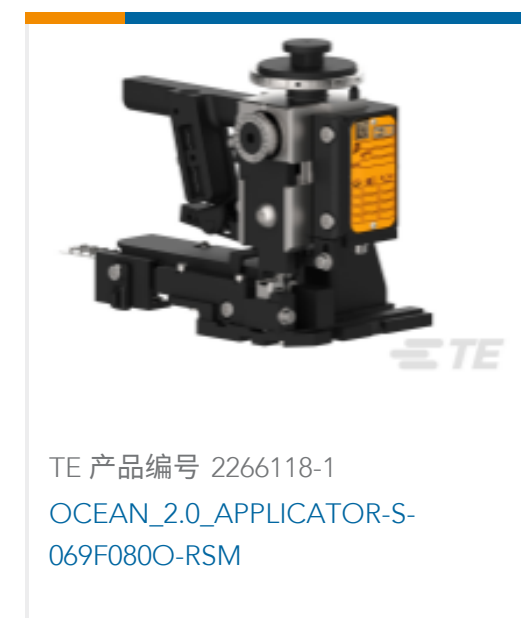
TE 产品编号 2266118-1 OCEAN_2.0-APPLICATOR-S-069F0800-RSM