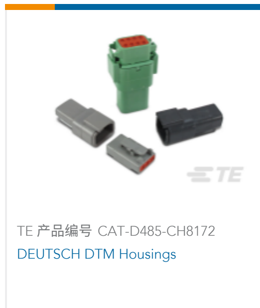
TE 产品编号 CAT-D485-CH8172 DEUTSCH DTM Housings