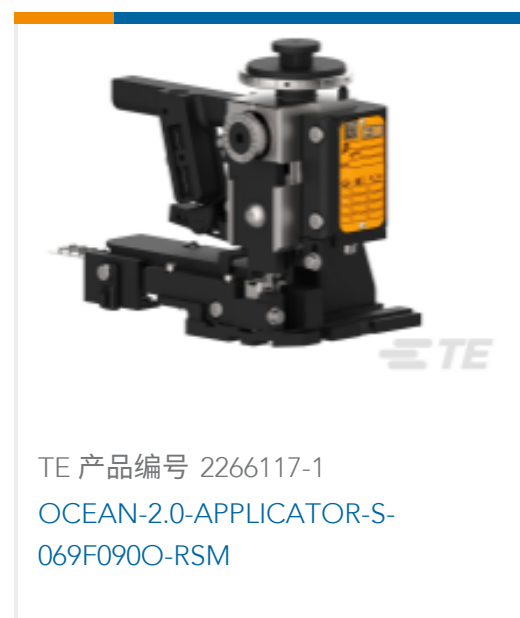
TE 产品编号 2266117-1 OCEAN-2.0-APPLICATOR-S-069F0900-RSM