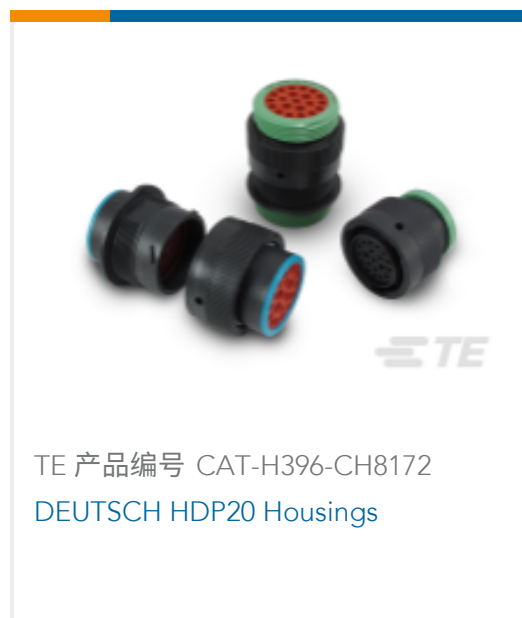
TE 产品编号 CAT-H396-CH8172 DEUTSCH HDP20 Housings