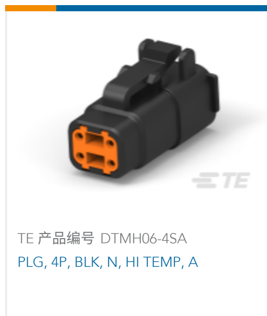
TE 产品编号 DTMH06-4SA PLG, 4P, BLK, N, HI TEMP, A