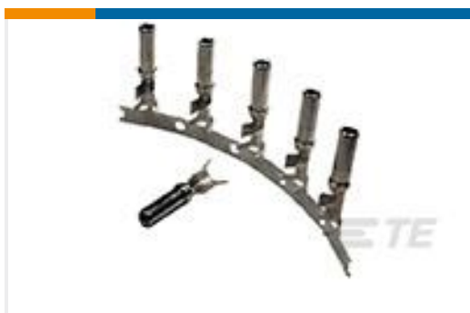
TE 产品编号1062-12-0166 SOC, SF, SIZE 12, 12-14, NI/SN