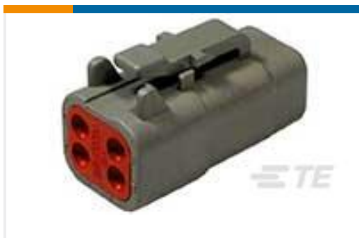
TE 产品编号DTM06-4S PLG, 4P, GRY, N