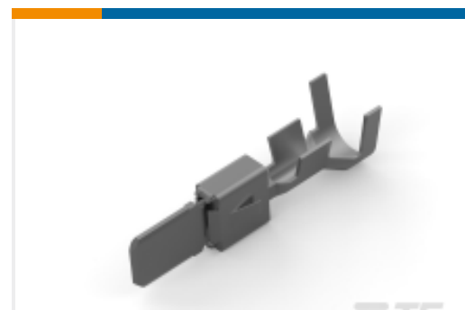
TE 产品编号1-963744-1 TAB CONTACT 5,08X0,8