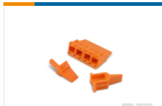
TE 产品编号WM-4S DEUTSCH DTM Wedgelocks