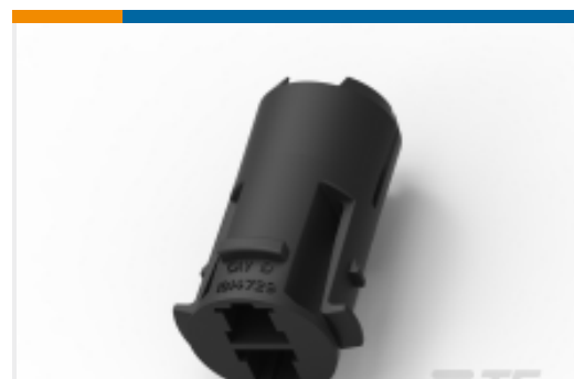
TE 产品编号1814729-4 BULB HOLDER LATCHED