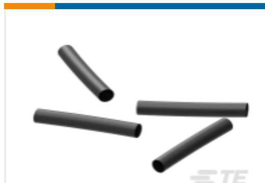
TE 产品编号EK5194-000 ES2000-NO.6-H2-0-39MM