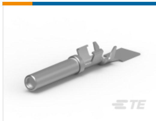
TE 产品编号1060-16-0122 DEUTSCH 16 号压接端子