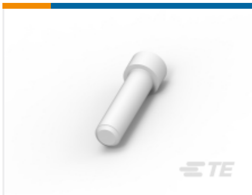
TE 产品编号114017-ZZ SEALING PLUG, SIZE 12/16, WHT