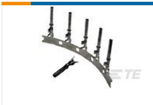
TE 产品编号1062-20-0122 SOC, SF, SIZE 20, 16-22, NI/NI