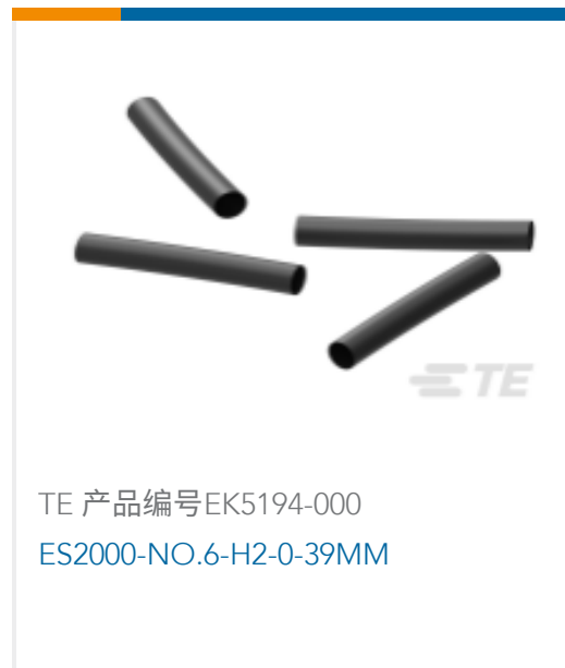
TE 产品编号EK5194-000 ES2000-NO.6-H2-0-39MM