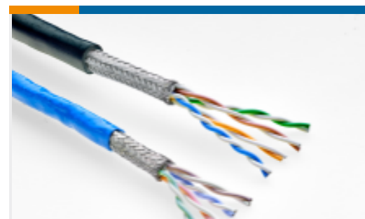
TE 产品编号EP9948-000 C5E-26C442XUU9A