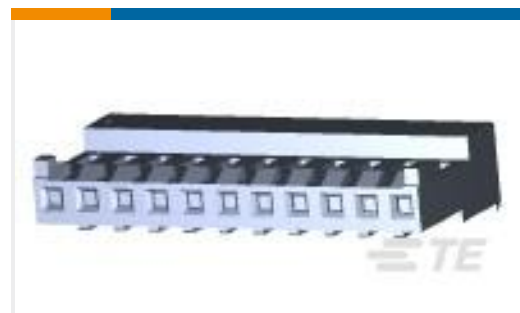
TE 产品编号4-643817-1 11P MTA156 CONN ASSY 18AWG ORA