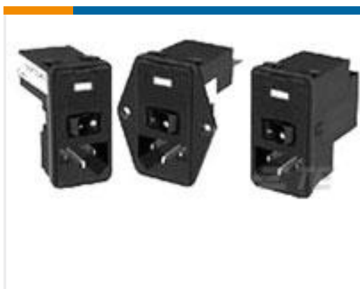
TE 产品编号4-1609156-1 PM0S0SMXE=C7115