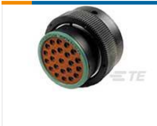
TE 产品编号HDP26-24-23PN PLG, 23P, BLK, N, 16, P