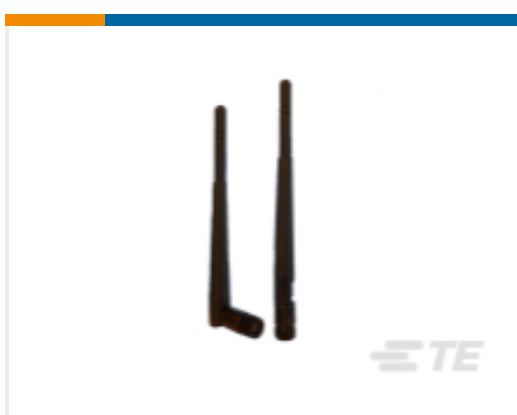
TE 产品编号RD2458-5-SMA Dipol,RDuck,Fixed,SMAM 2400- 5850MHz,5dBi