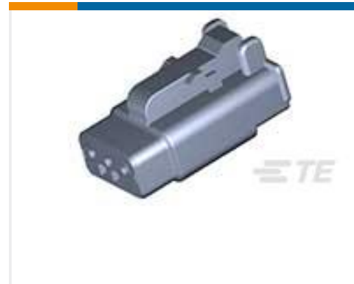
TE 产品编号DTMH06-3SA PLG, 3P, BLK, N, HI TEMP, A