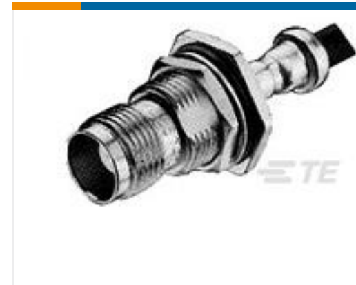
TE 产品编号5414168-3 JACK,BULKHEAD,COM'L TNC