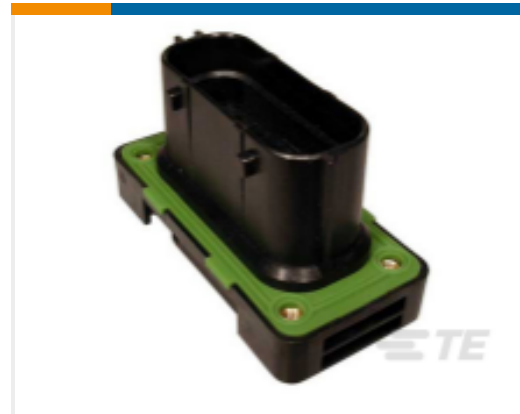
TE 产品编号SRK02-MDA-32A-001 REC, 32P, BLK, E, FLANGE, A