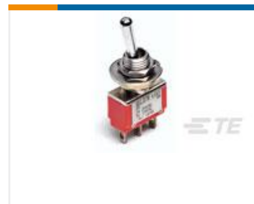
TE 产品编号4-1825136-4 A101SYCB04