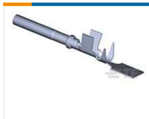
TE 产品编号1062-20-0622 SOC, SF, SIZE 20, 14-16, NI/NI