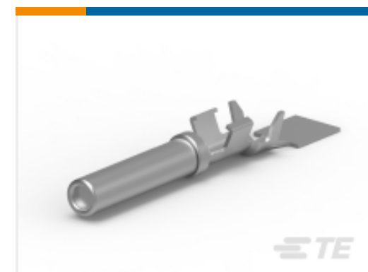
TE 产品编号1062-16-0722 DEUTSCH 16号压接端子