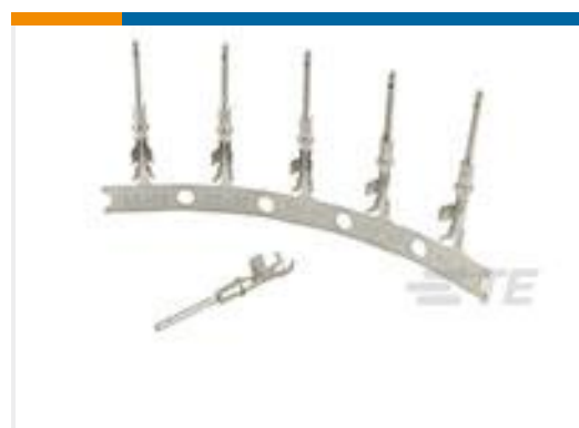
TE 产品编号1060-20-0222 PIN, SF, SIZE 20, 16-22, NI/NI