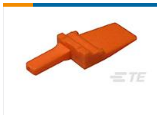
TE 产品编号WM-2P WEDGE LOCK, 2P, REC, ORG, DTM