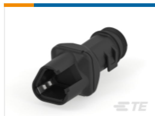
TE 产品编号1011-259-0305-V2 DT BACKSHELL 180 3way plug strain rel.