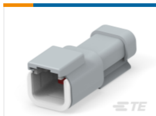
TE 产品编号DTM04-2P-P083 REC, 2P, GRY, 220 OHM RESISTOR, AU, A