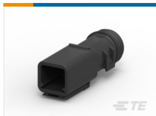
TE 产品编号1011-229-0205 BKSHL, 2P, BLK, REC, ST, NW6/7.5/8.5 /10