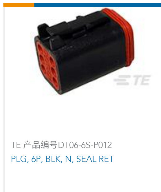
TE 产品编号DT06-6S-P012 PLG, 6P, BLK, N, SEAL RET