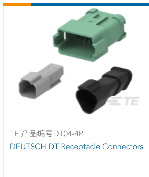
TE 产品编号DT04-4P DEUTSCH DT Receptacle Connectors