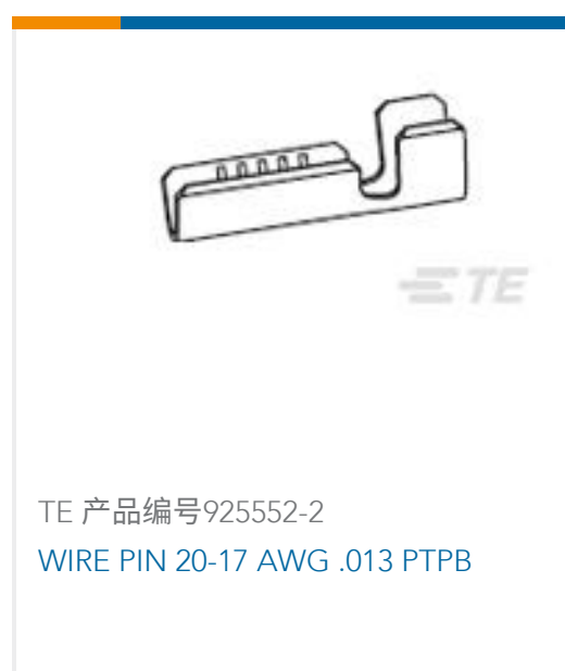
TE 产品编号925552-2 WIRE PIN 20-17 AWG .013 PTPB