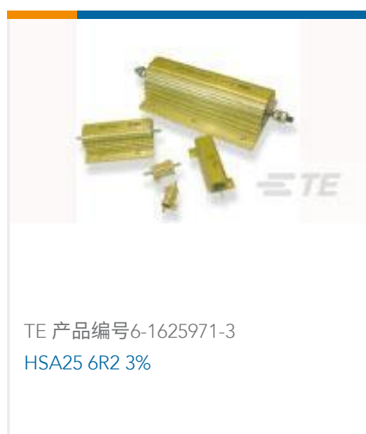
TE 产品编号6-1625971-3 HSA25 6R2 3%