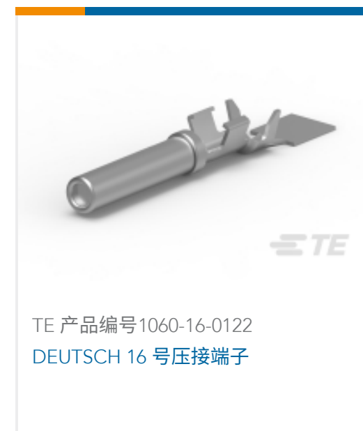
TE 产品编号1060-16-0122 DEUTSCH 16 号压接端子