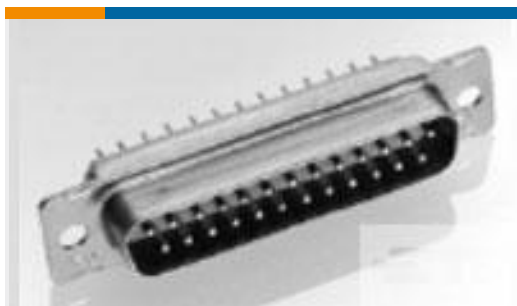
TE 产品编号1757819-7 AMPLIMITE,ASY,PLUG,STD,109,ZN,2,CT