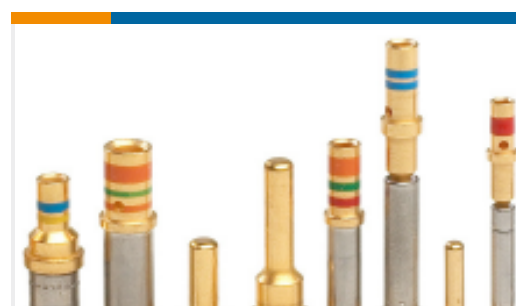
TE 产品编号2560-201-2031L CONT PIN