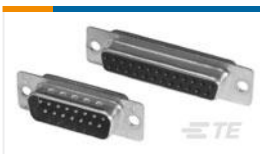
TE 产品编号5-747905-7 9 Rcpt Solder Cup, G/F w/ CN,