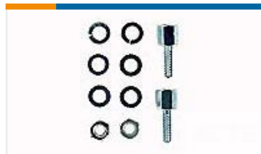
TE 产品编号5207952-1 KIT SCREWLOCK FEMALE