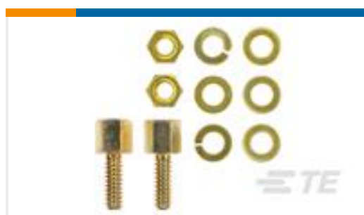
TE 产品编号5205817-1 KIT SCREWLOCK FEMALE