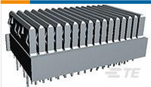
TE 产品编号1410128-1 MULTIGIG RT T2 1" BP FULL RGHT