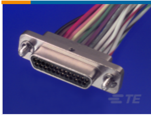
TE 产品编号1-1532181-1 M83513/03-C15N, MCKS-N1-B-21P6Q1-72.0