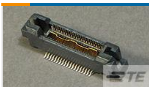
TE 产品编号5767007-8 MICT,260PLUG,38,ASSY,.025,REC