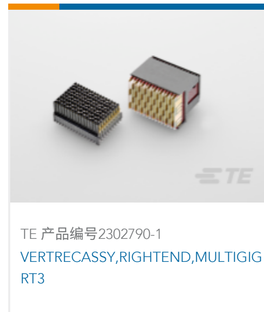
TE 产品编号2302790-1 VERTRECCASSY, RIGHTEND, MULTIGIG RT3