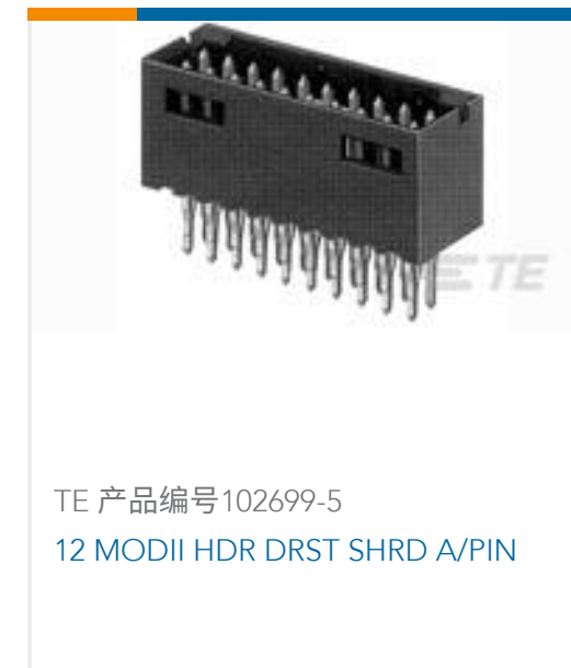
TE 产品编号102699-5 12 MODII HDR DRST SHRD A/PIN