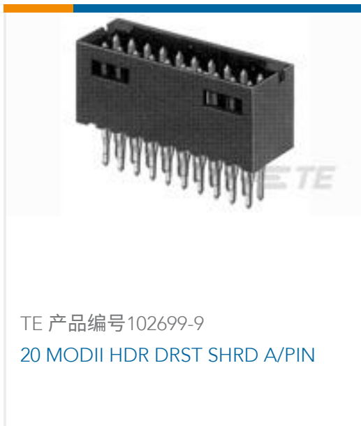
TE 产品编号102699-9 20 MODII HDR DRST SHRD A/PIN