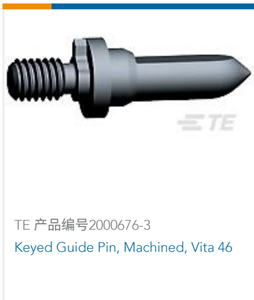
TE 产品编号2000676-3 Keyed Guide Pin, Machined, Vita 46