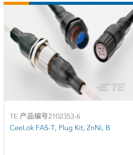
TE 产品编号2102353-6 CeeLok FAS-T, Plug Kit, ZnNi, B