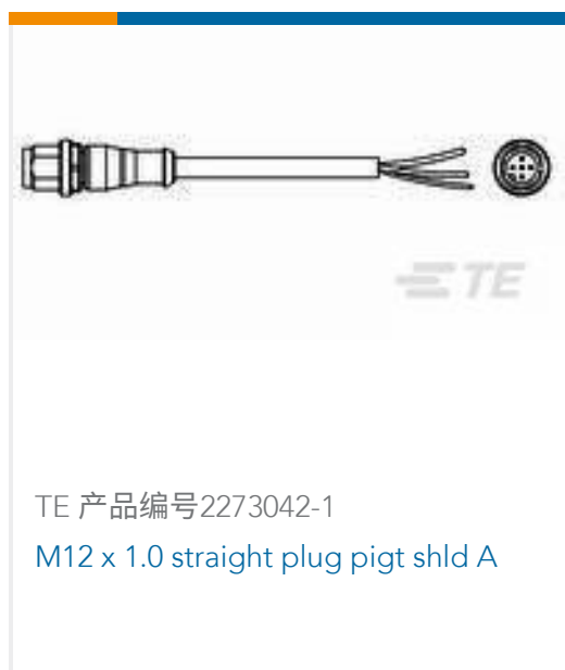
TE 产品编号2273042-1 M12 x 1.0 straight plug pigt shld A