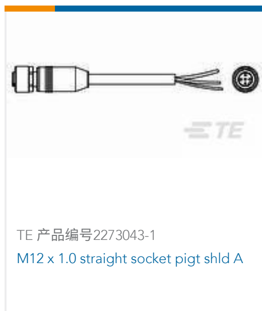
TE 产品编号2273043-1 M12 x 1.0 straight socket pigt shld A