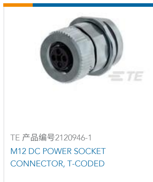
TE 产品编号2120946-1 M12 DC POWER SOCKET CONNECTOR, T-CODED