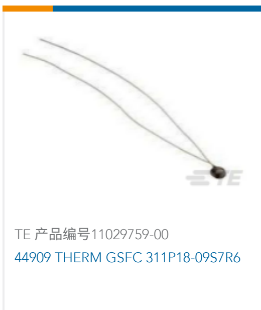
TE 产品编号11029759-00 44909 THERM GSFC 311P18-09S7R6