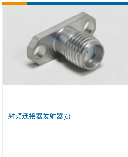
射频连接器发射器(6)