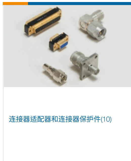
连接器适配器和连接器保护件(10)