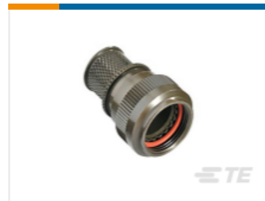
TE 产品编号BTA1-18-10-1-B BTA1-18-10-1-B