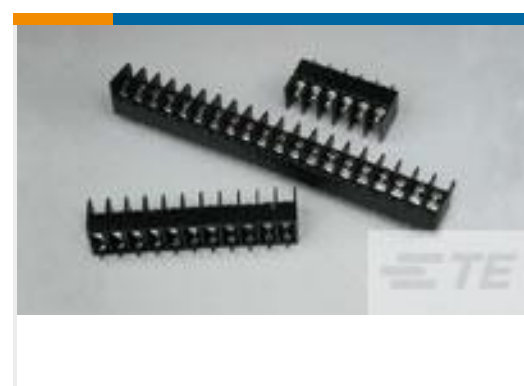
TE 产品编号1546657-5 SP PCV DUAL BARRIER,0.250