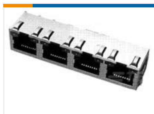
TE 产品编号5406552-2 INV MJ,1X4,PNL GRD,LED (G/-)