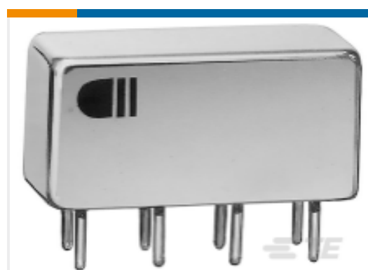
TE 产品编号2-1617073-1 DPDT Relay:Electrically-Held, 1/5-Size Relay