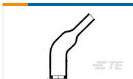
TE 产品编号980286-000 242W042-25-0