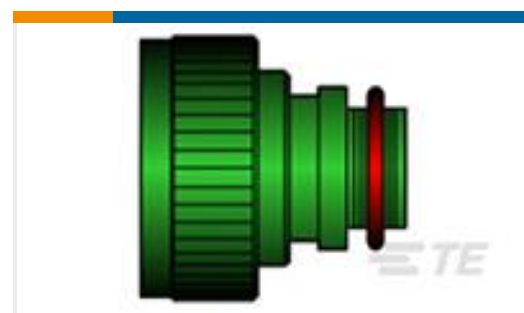
TE 产品编号293973-000 TXR40AB00-1612AI