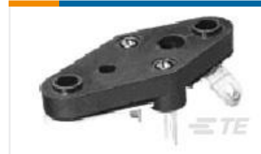
TE 产品编号4-1437504-3 8080-1G31=TRANSISTOR SOCKET AS