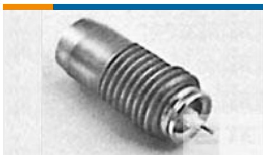
TE 产品编号1059632-1 4557 5119 02