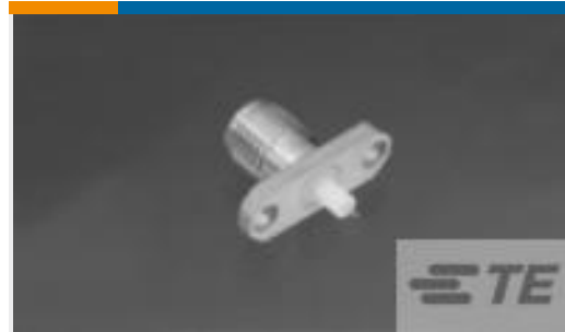
TE 产品编号1052952-1 2052 8015 92