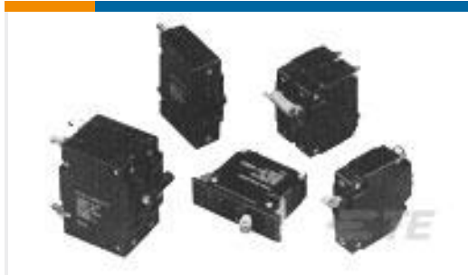
TE 产品编号1393255-6 W93-X112-25=M6/M7/M9/W6/W7