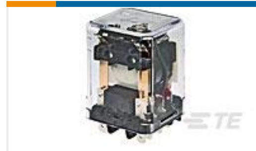
TE 产品编号8-1393113-6 KUEP-11D15-12=KU