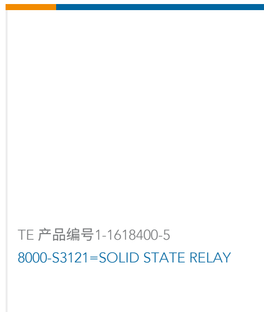
TE 产品编号1-1618400-5 8000-S3121=SOLID STATE RELAY