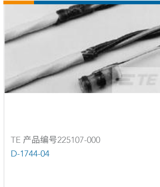
TE 产品编号225107-000 D-1744-04