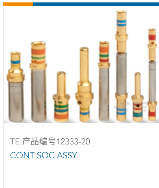
TE 产品编号12333-20 CONT SOC ASSY