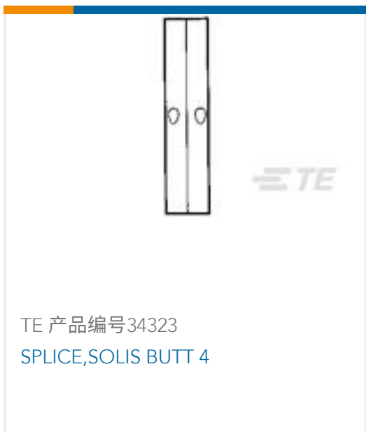
TE 产品编号34323 SPLICE,SOLIS BUTT 4