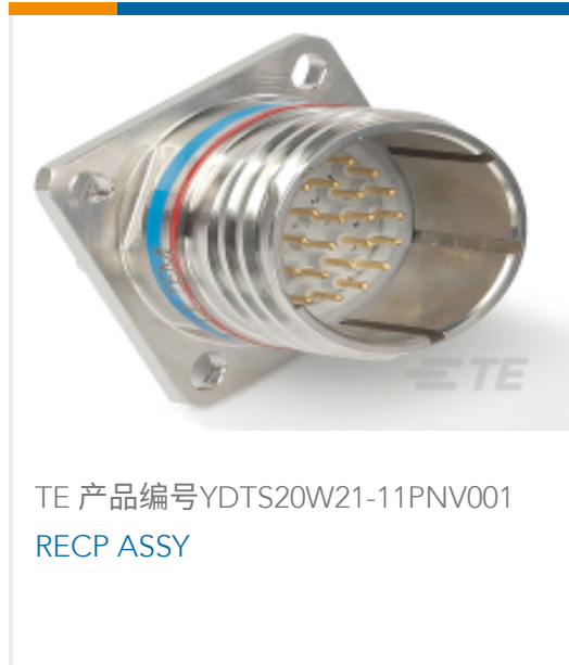
TE 产品编号YDTS20W21-11PNV001 RECP ASSY