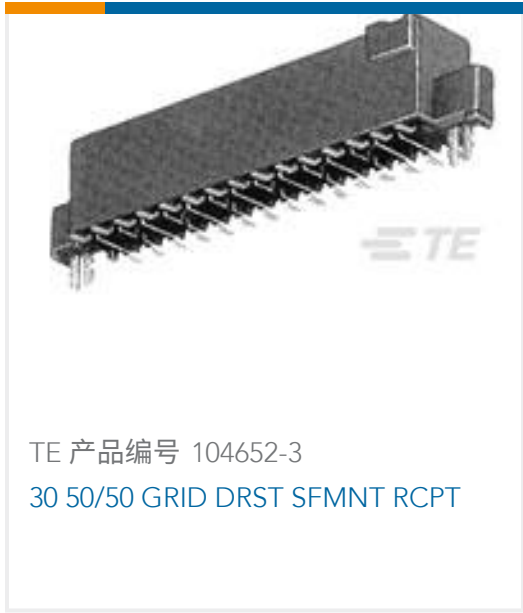
TE 产品编号 104652-3 30 50/50 GRID DRST SFMNT RCPT