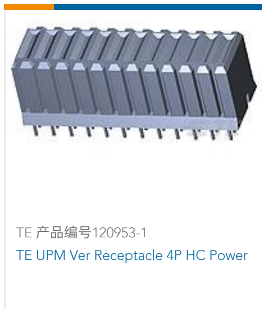
TE 产品编号120953-1 TE UPM Ver Receptacle 4P HC Power