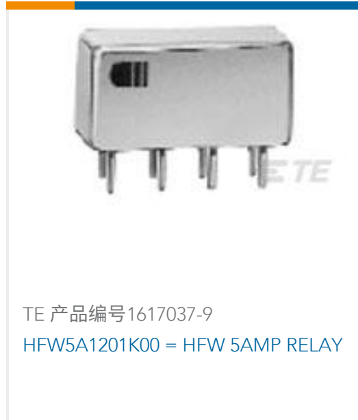
TE 产品编号1617037-9 HFW5A1201K00 = HFW 5AMP RELAY