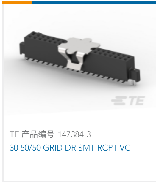
TE 产品编号 147384-3 30 50/50 GRID DR SMT RCPT VC