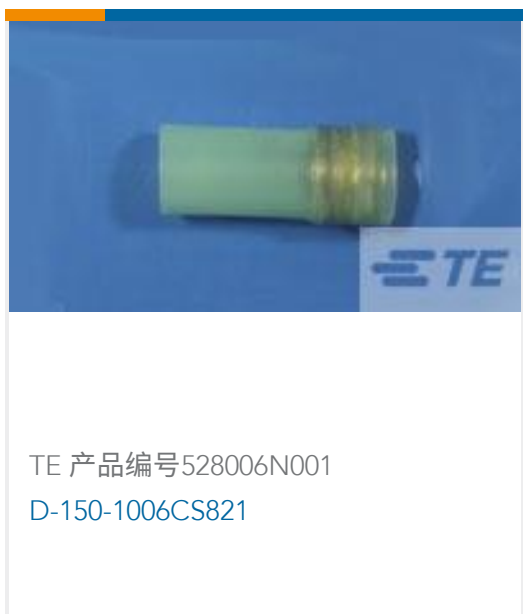
TE 产品编号528006N001 D-150-1006CS821