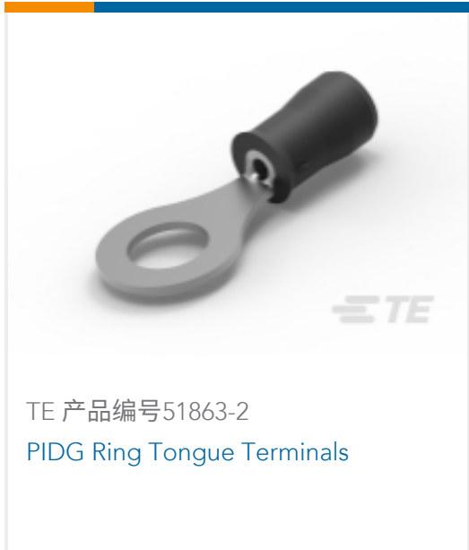
TE 产品编号51863-2 PIDG Ring Tongue Terminals