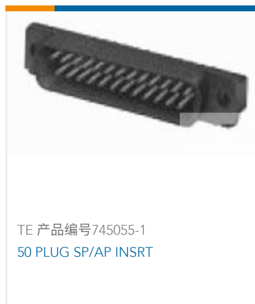
TE 产品编号745055-1 50 PLUG SP/AP INSRT