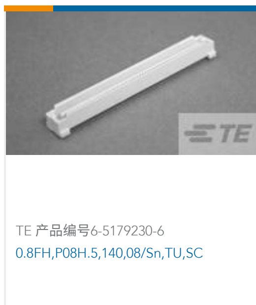
TE 产品编号6-5179230-6 0.8FH,P08H.5,140,08/Sn,TU,SC