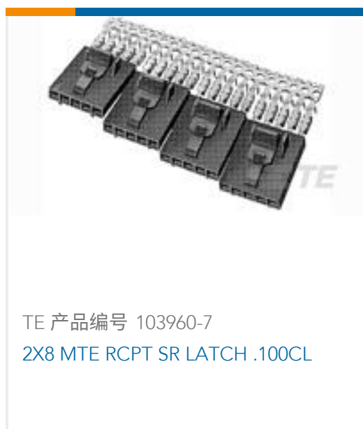
TE 产品编号 103960-7 2X8 MTE RCPT SR LATCH .100CL