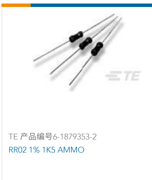
TE 产品编号6-1879353-2 RR02 1% 1K5 AMMO