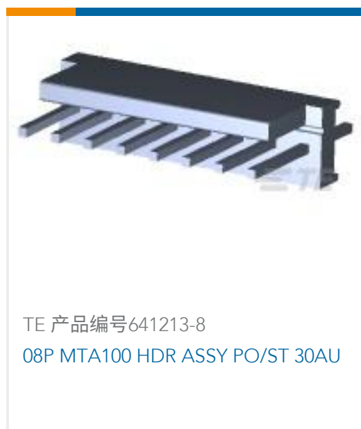
TE 产品编号641213-8 08P MTA100 HDR ASSY PO/ST 30AU