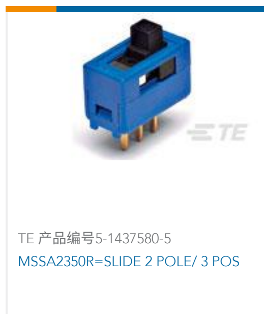
TE 产品编号5-1437580-5 MSSA2350R=SLIDE 2 POLE/ 3 POS