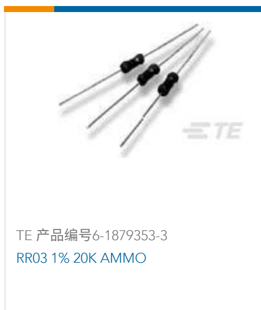
TE 产品编号6-1879353-3 RR03 1% 20K AMMO