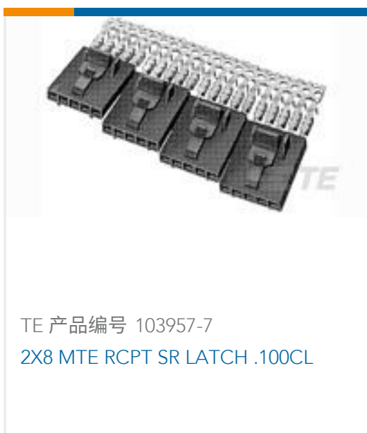
TE 产品编号 103957-7 2X8 MTE RCPT SR LATCH .100CL