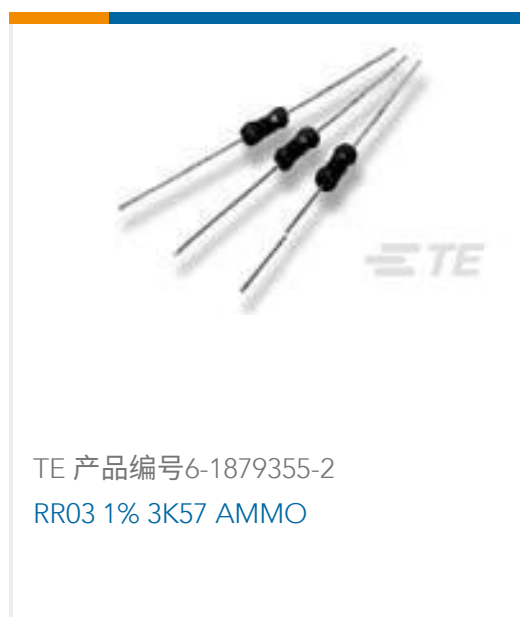
TE 产品编号6-1879355-2 RR03 1% 3K57 AMMO