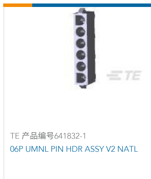
TE 产品编号641832-1 06P UMNL PIN HDR ASSY V2 NATL