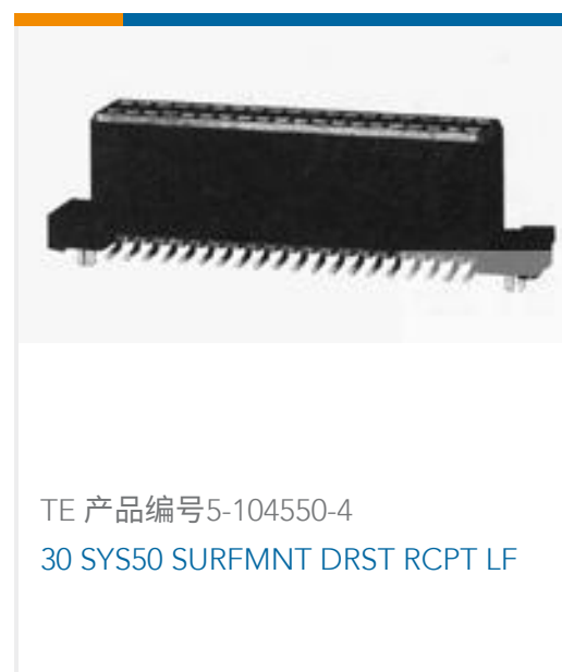
TE 产品编号5-104550-4 30 SYS50 SURFMNT DRST RCPT LF