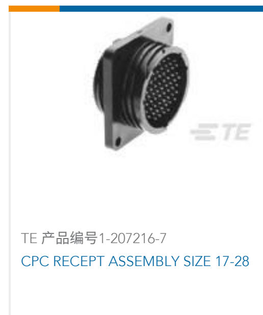
TE 产品编号1-207216-7 CPC RECEPT ASSEMBLY SIZE 17-28