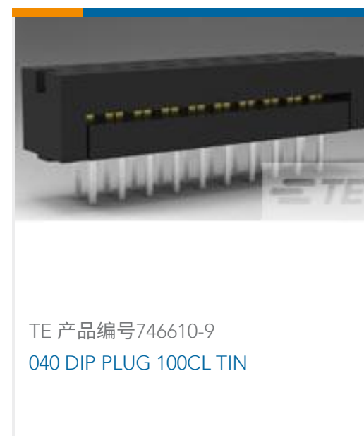
TE 产品编号746610-9 040 DIP PLUG 100CL TIN