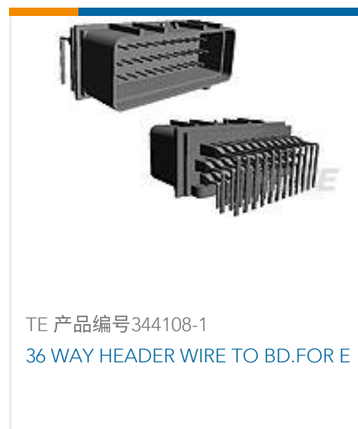
TE 产品编号344108-1 36 WAY HEADER WIRE TO BD.FOR E