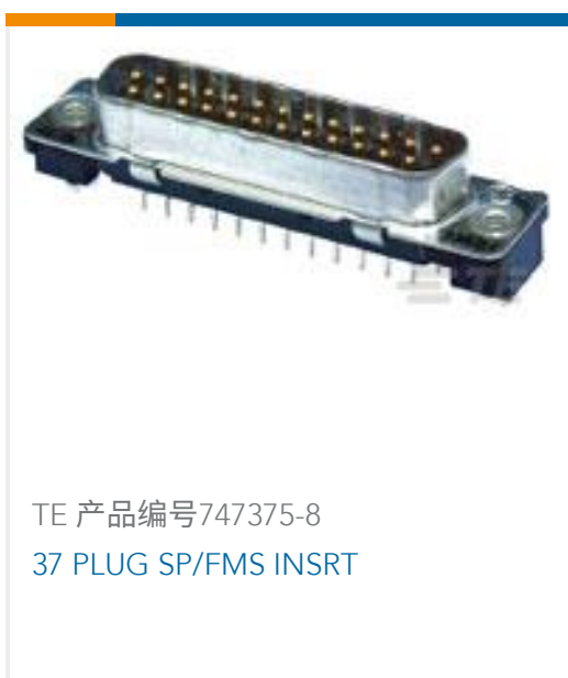
TE 产品编号747375-8 37 PLUG SP/FMS INSR