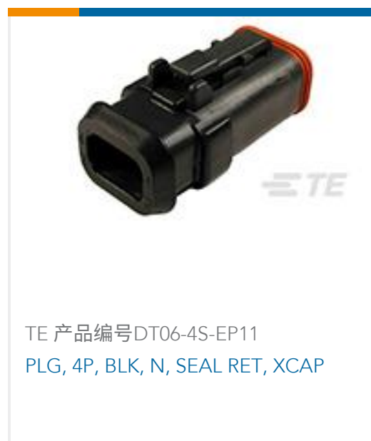
TE 产品编号DT06-4S-EP11 PLG, 4P, BLK, N, SEAL RET, XCAP