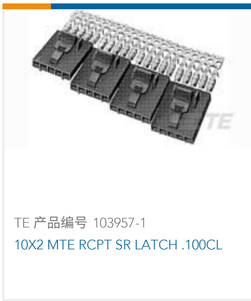
TE 产品编号 103957-1 10X2 MTE RCPT SR LATCH .100CL