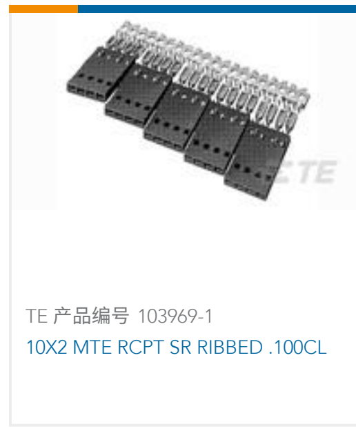
TE 产品编号 103969-1 10X2 MTE RCPT SR RIBBED .100CL