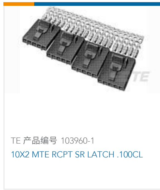
TE 产品编号 103960-1 10X2 MTE RCPT SR LATCH .100CL