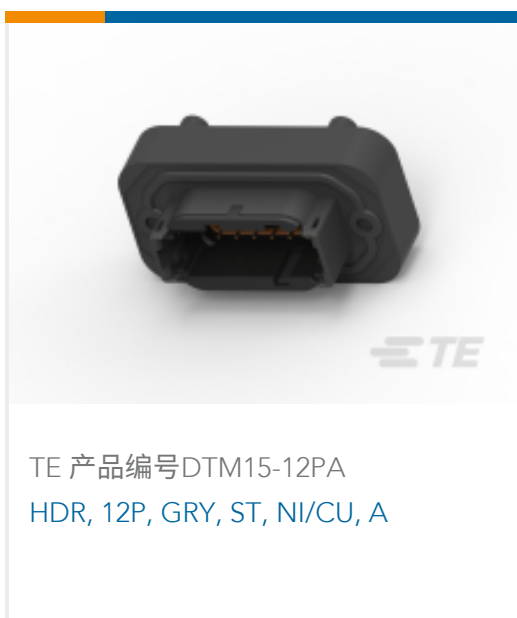
TE 产品编号DTM15-12PA HDR, 12P, GRY, ST, NI/CU, A