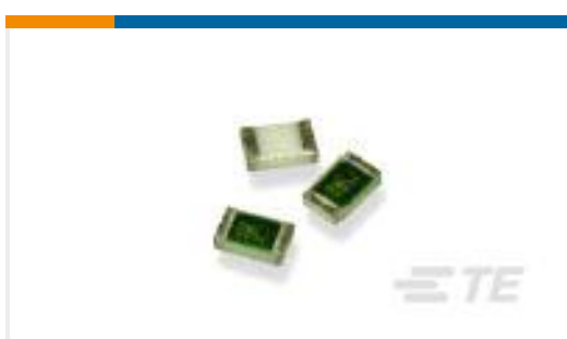
TE 产品编号2-1879215-7 CPF 0402 7K68 0.1% 25PPM 1K RL