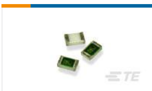
TE 产品编号3-1879215-2 CPF 0402 8K66 0.1% 25PPM 1K RL