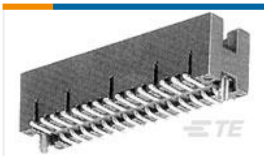
TE 产品编号5-104655-3 20 50/50 HDR DRST SFMNT TIN