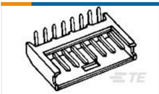
TE 产品编号280378-2 4P MODU II SHRD HDR, RT ANG, 0.38 AU