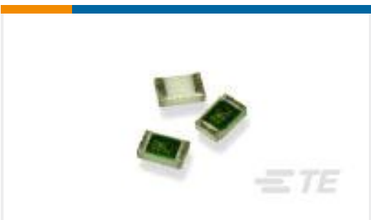
TE 产品编号1879215-4 CPF 0402 4K32 0.1% 25PPM 1K RL