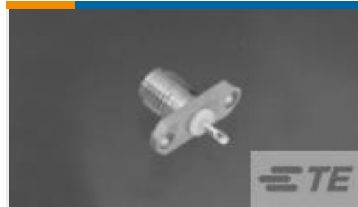
TE 产品编号1052699-1 2052 3510 02