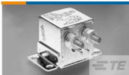
TE 产品编号9-1617800-5 FCAC-150-CU4=50 AMP MID-RANGE RELAY