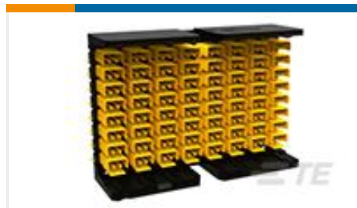
TE 产品编号2180824-3 SW, HDR, 8x8, Thick, Sn