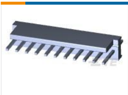
TE 产品编号1-640454-1 11P MTA100 HDR ASSY SQ STR POL