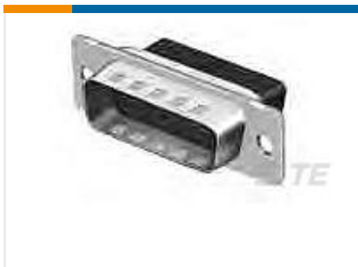
TE 产品编号205206-3 CRIMP SNAP PLUG ASSY,SIZE 2