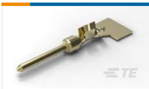
TE 产品编号66506-9 PIN CONTACT, 20 DF