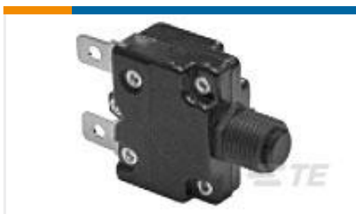
TE 产品编号5-1423364-8 W57-XB6A99C10-12=CKTBKR,THERM, PB,QC.250