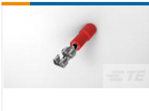
TE 产品编号640925-1 RECEPT,PIDG FASTON 22-18 110