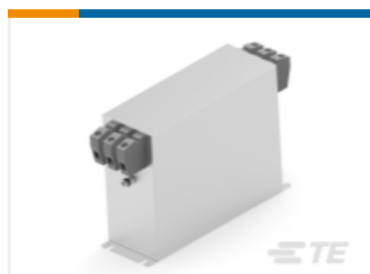
TE 产品编号2405077-8 50 AHV S BS