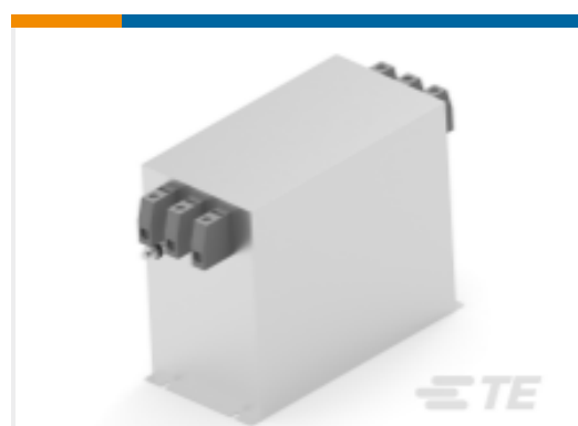
TE 产品编号1-2405077-4 125 AHV S BS