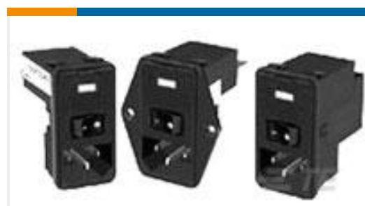
TE 产品编号7-6609107-3 PS0S0SS3A=C1186