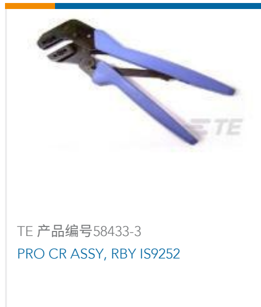
TE 产品编号58433-3 PRO CR ASSY, RBY IS9252