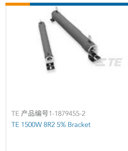
TE 产品编号1-1879455-2 TE 1500W 8R2 5% Bracket