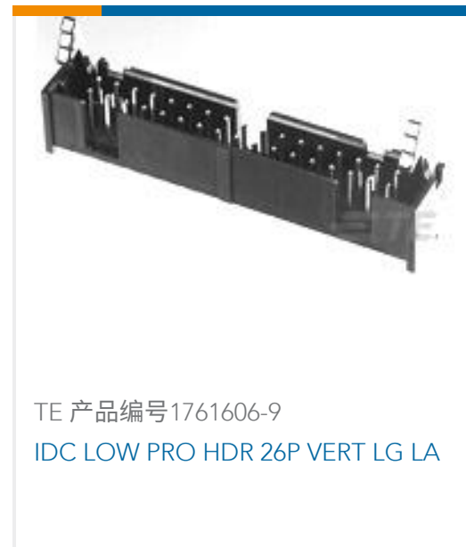
TE 产品编号1761606-9 IDC LOW PRO HDR 26P VERT LG LA