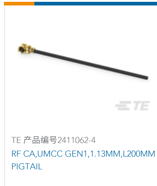
TE 产品编号2411062-4 RF CA,UMCC GEN1,1.13MM,L200MM PIGTAIL