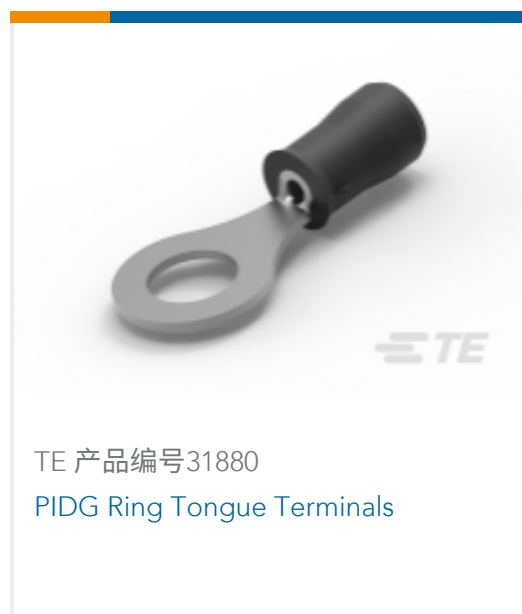
TE 产品编号31880 PIDG Ring Tongue Terminals