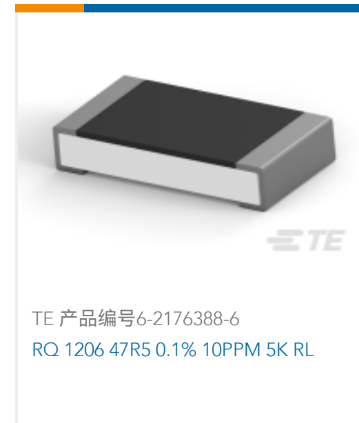
TE 产品编号6-2176388-6 RQ 1206 47R5 0.1% 10PPM 5K RL