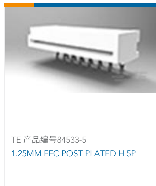
TE 产品编号84533-5 1.25MM FFC POST PLATED H 5P