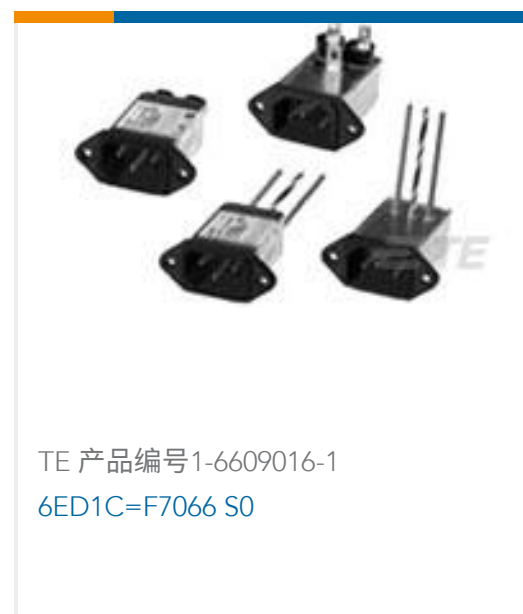
TE 产品编号1-6609016-1 6ED1C=F7066 S0